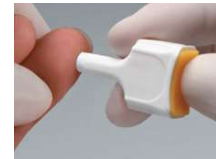
2. Stechhilfe fest auf die Einstichstelle setzen und den Auslöseknopf drücken