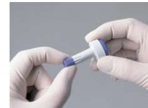
2. Stechtiefe bei Bedarf durch Drehen des Einstellringes ändern