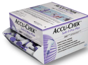
Accu-Chek Safe-T-Pro Plus 200 Stück Materialnummer 03603539150 PZN 01754184