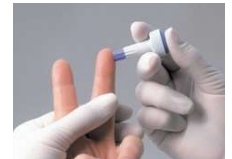
3. Stechhilfe fest auf die Einstichstelle setzen und den Auslöseknopf drücken