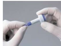
1. Sterilkappe abdrehen