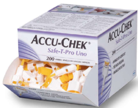
Accu-Chek Safe-T-Pro Uno 200 Stück Materialnummer 05888662150 PZN 06143663

Für die Anwendung in Klinik und Praxis: Accu-Chek Safe-T-Pro Uno und Accu-Chek Safe-T-Pro Plus